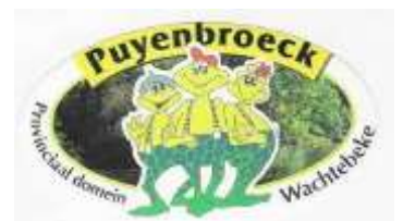
Kris le Compte en Tina