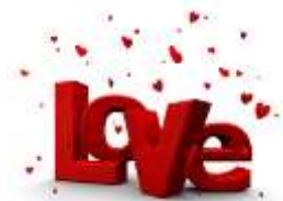
Kris Le Compte