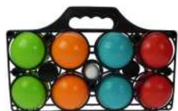
Veronique en Dieter