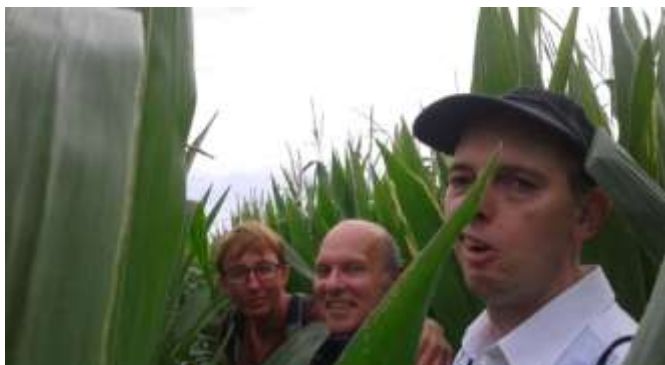
Er even tussenuit....