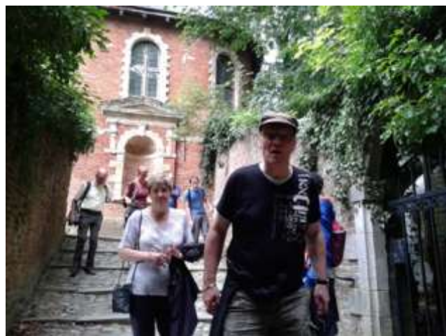
Kastelenwandeling te Gaasbeek, kasteel van Gaasbeek, Groenenberg en Baljuwhuis...