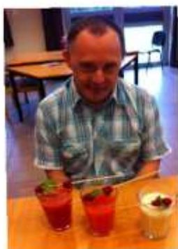
Voilà, het resultaat