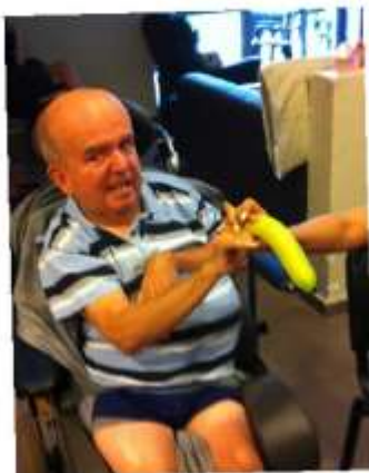
Schieten met bananen