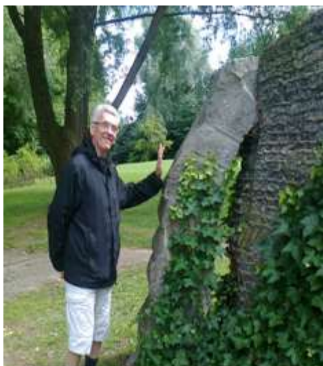
Het kunstwerk met de grote neus