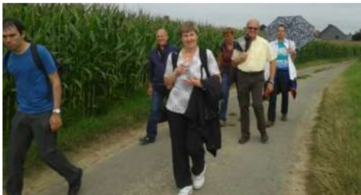
Alle stappers van het dagcentrum en huis Eygen in augustus een dagje op pad...