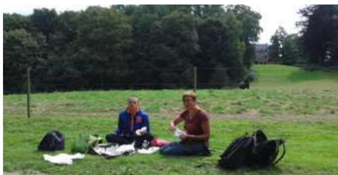
lekkere picnic, americain wat pikant....