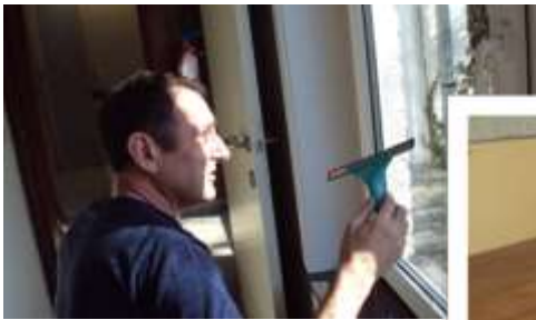
Lenteschoonmaak.... Onze bezoekers helpen graag bij licht huishoudelijk werk.